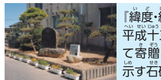
『緯度・経度』の石碑 平成十三年卒業生より卒業記念として 寄贈された旧豊間中学校の位置を 示す石碑