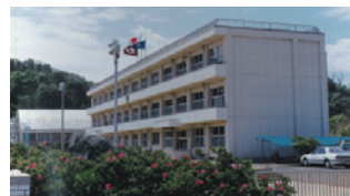
ハマナスの咲く校門