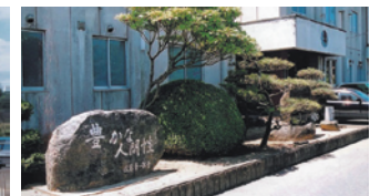
『豊かな人間性』の石碑