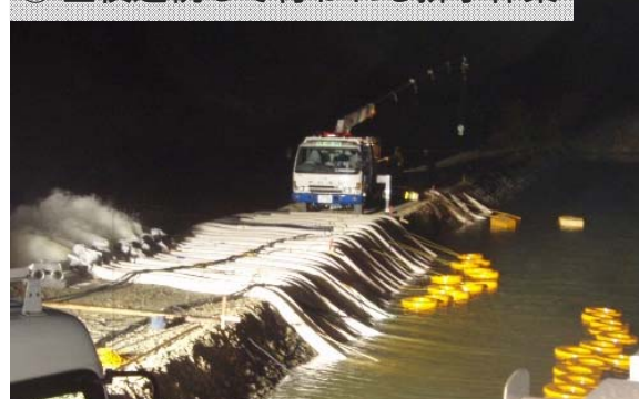
⑥ 昼夜連続して行われる排水作業