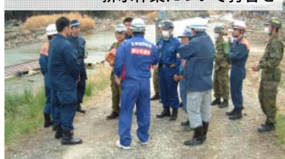
② 自衛隊、消防等関係機関と排水作業について打合せ