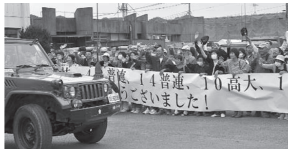
▲5月23日、感謝の気持ちいっぱいで見送ったお別れセレモニー。