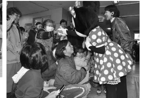
▲ディズニーランドからミッキーたちも応援に駆けつけてくれました。子どもからお年寄りまで、皆さん大喜び。