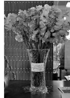
▲宮崎県から励ましのメッセージ付きスイーツが贈られました。