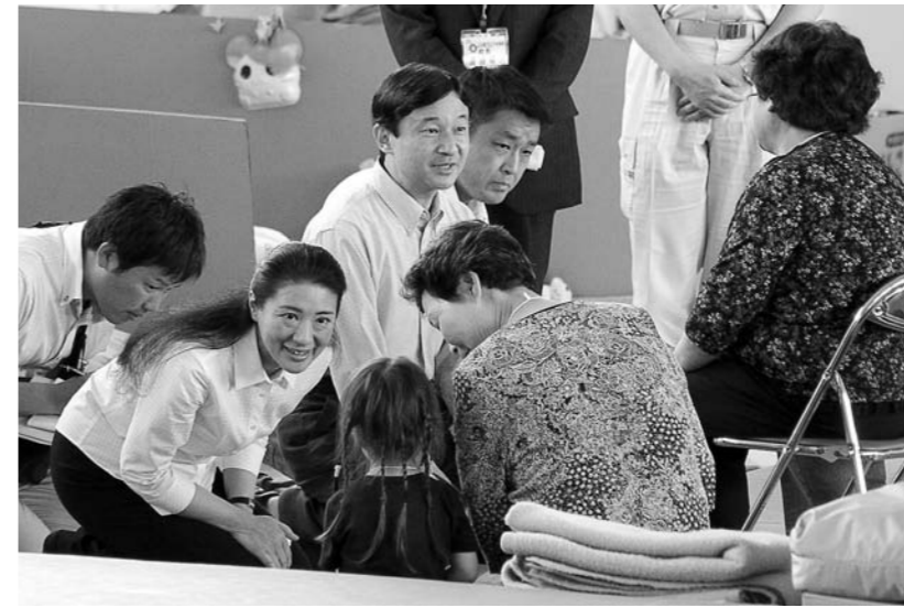
▲皇太子ご夫妻が山下中避難所を行啓。避難者一人ひとりにお声をかけられました。