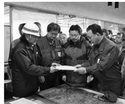
▲3月27日谷垣自民党総裁来庁