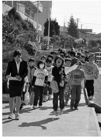
▲4月25日震災後初の登校日 (山下小学校)