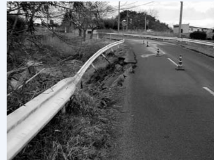
甚大な被害を受けた仙南・仙塩広域水道管(大平区)

3月11日に発生した東日本大震災においては、町内の水道管が甚大な被害を受け、大規模な断水が起きました。皆様には、大変ご不便をおかけしました。