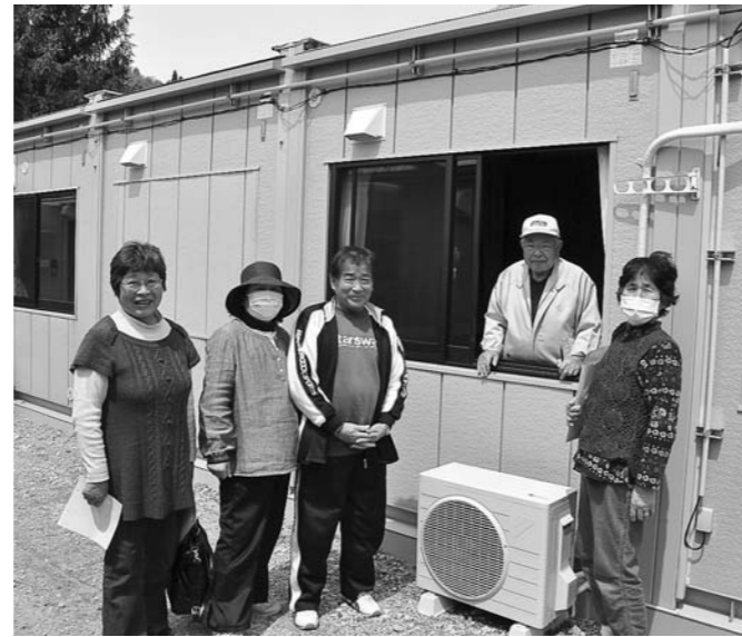
▲4月30日仮設住宅入居開始(坂中跡地) 7月27日現在、928戸完成・1,870人入居完了