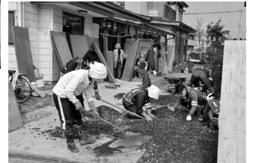
▲県内外から大勢のボランティアが支援に訪れています。(7月27日現在延べ12,786人)