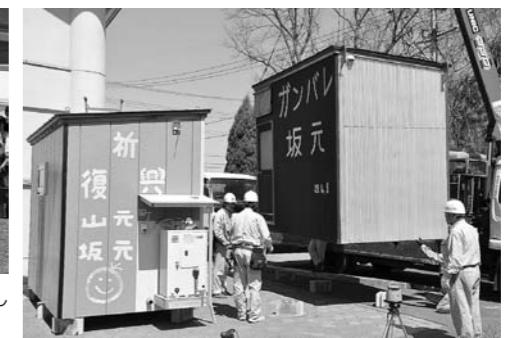
▲おけさのつながりで秋田県の建築業者から入浴施設が届けられました。(坂元中学校)