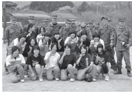
▲ソフトボールの試合を通じ、中学生や避難者との交流を深めました。

ただいた支援の数々私たちは忘れません。本当にありがとうございました。 なお、第10師団から任務を引き継いだ東北方面特科連隊(仙台市若竹駐屯地)についても、8月1日をもって約2か月間にわたる支援活動を終え、撤収されました。