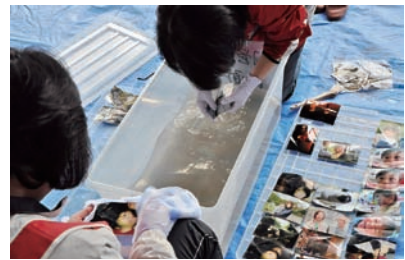
1枚1枚、心をこめて丁寧に洗浄していきます

参加者の皆さんは、参加した目的について「2度と取り戻すことができない思い出を救うお手伝いがしたかった」と口をそろえて話します。