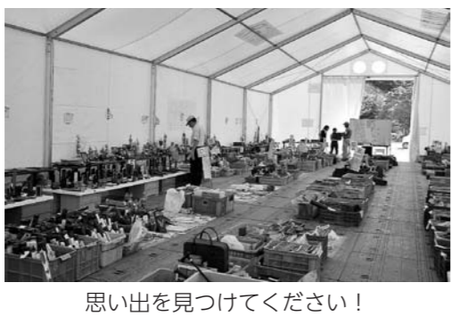
思い出を見つけてください!

ただし、「位牌・遺影・賞状・その他持ち主の氏名が分かるもの」については、引き続き伝承館前プレハブで展示・引き渡しを行います。 期間 9月1日(木)～当面の間(土・月を除く毎日) 時間 9時～15時