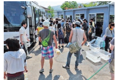
週末には、多くの方が支援に訪れます