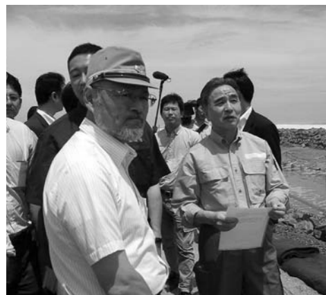
▲7月24日平野復興担当大臣現地視察