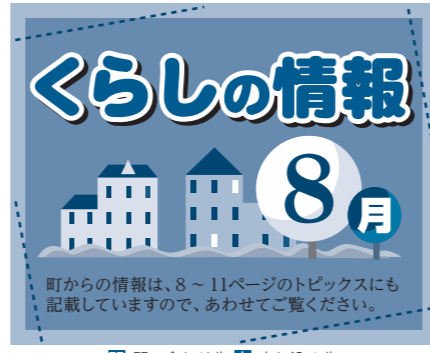
☎: 問い合わせ先 ☑: 申し込み先

ハローワーク仙台による巡回相談 ハローワーク仙台では、町内避難所において、次のとおり巡回相談を実施します。 求人情報の提供や職業紹介など、お仕事探しに関するさまざまなご相談をお受けしていますので、お気軽にご利用ください。 ■対象となる方 東日本大震災により被災し、町内の避難所・仮設住宅にお住まいの方 ■巡回相談の内容 ○初めてハローワークを利用する方は、ハローワークに