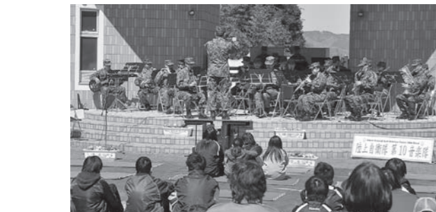
▲力強い、真心のこもった演奏に、元気をいただきました。