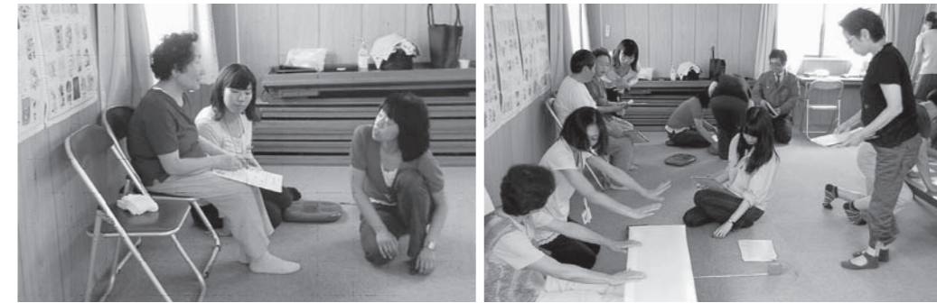
体重は震災前と比べてどうですか？ 柔軟性もチェック。ゆっくり伸ばしてくださいね。

参加者からは、「自分の体を振り返る機会となった」「これからも震災前のように運動や食事に気をつけたい」などの声が聞かれました。 町では、今後も定期的に健康づくりのための各種教室を実施していきます。