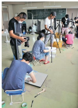
複写・デジタル化作業。ボランティアの中には、日本を代表するカメラマンも

このほかにも、この取り組みに賛同した横浜市の写真スタジオや東京都、滋賀県の方からも協力の申し出があり、各地において洗浄作業に協力いただくなど、本町への支援の輪が全国的な広がりを見せています。