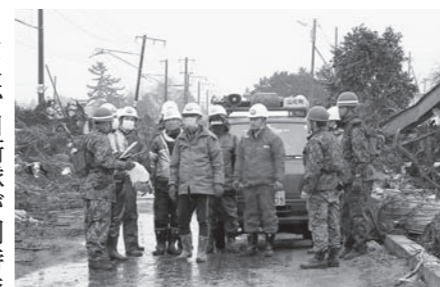
▲自衛隊に捜索区域の情報提供を行う団員

陸上自衛隊着任後には、二次災害の危険と隣り合わせの状況下、地元消防団ならではの機動力を生かし、被災地域内で自衛隊を先導しながらの救助活動や行方不明者の捜索活動に従事。多くの人命救助や遺体の発見に貢献しました。