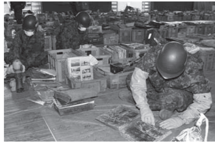
▲作業の合間をぬって、思い出の品の泥落としを行っていただきました。