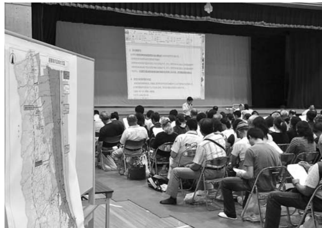
▲6月29日避難指示解除区域に関する説明会