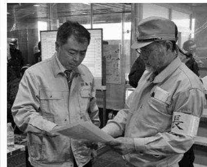
▲4月8日桜井財務副大臣来庁