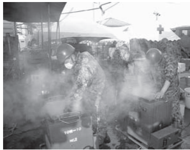
▲毎日、心のこもったあたたかい炊き出しが避難者に提供されました。