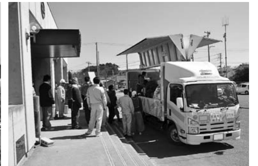
▲全国からたくさんの温かい支援が寄せられました。