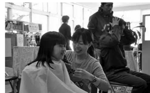
▲中央公民館の散髪ボランティア。久々のカットに自然と笑みがこぼれます。