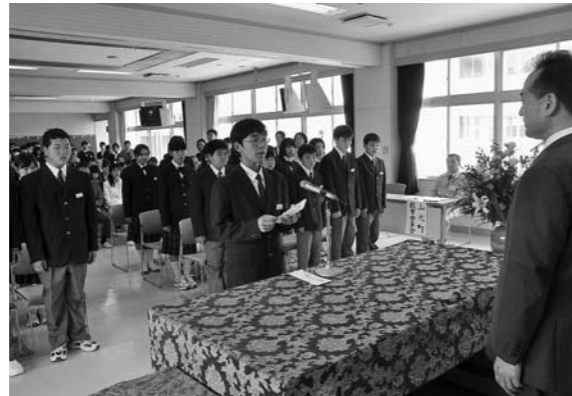
▲4月26日入学式(坂元中学校)