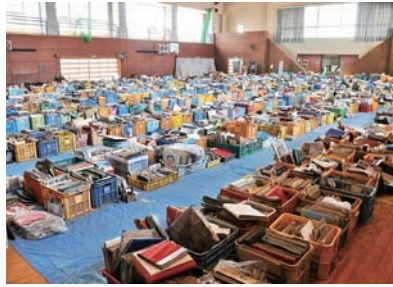
回収された膨大な数のアルバム

町内被災地域から自衛隊によって集められてきた約7,500冊のアルバムと約15万枚の写真。