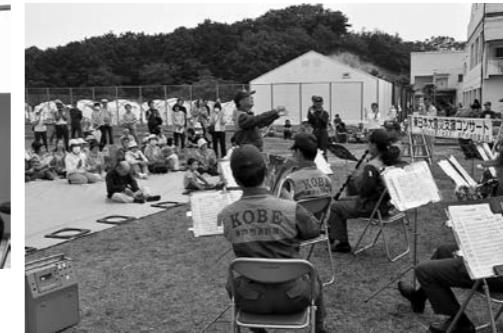
▲神戸市消防局音楽隊による震災復興コンサート。心温まる演奏に勇気と希望をいただきました。