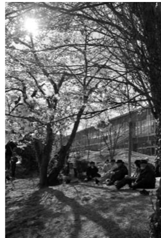
▲4月17日山下中学校で避難所主催の花見を開催