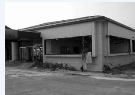
山元浄化センター(花釜区)

町内5つの処理施設は、坂元地区農集排処理施設(町区)を除く4つの施設が津波による被害を受け、全壊または半壊しており、下水道の完全復旧まで1年以上を要する見込みとなっています。(宮城県沿岸部の下水道処理施設も同様に被災)