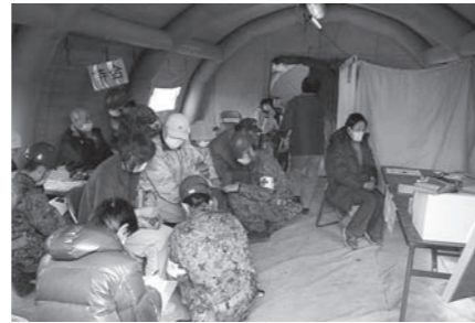
▲山下小には診療所を開設していただきました。