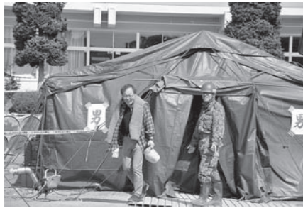
▲設置から126日間で約60,000人が利用した「尾張の湯」。

ただいた支援の数々私たちは忘れません。本当にありがとうございました。 なお、第10師団から任務を引き継いだ東北方面特科連隊(仙台市若竹駐屯地)についても、8月1日をもって約2か月間にわたる支援活動を終え、撤収されました。