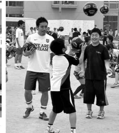
▲長友佑人選手のサッカー教室。