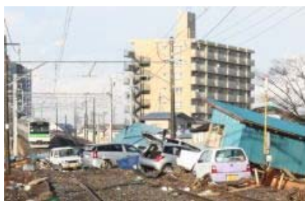
▲仙石線：八幡踏切（3月24日撮影）