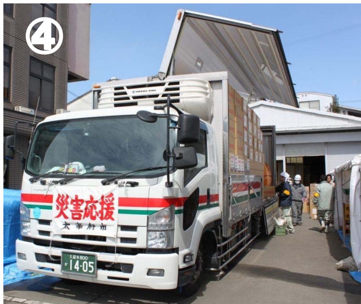
写真① 天真小学校卒業式 写真② 炊き出しの沖繩そばを食べました 写真③ ボランティアと作成した子ども新聞より 一部抜粋 写真④ 太宰府市からの災害応援