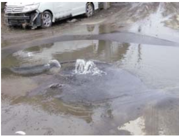
▲マンホールからあふれた汚水