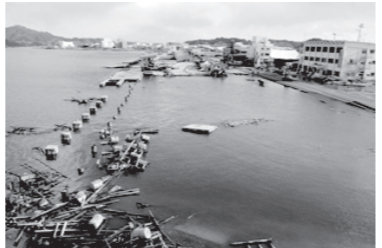
まち復興を計画的に進めるため、被災地の一部について建築が制限されます

地域内の無秩序な建築を防ぎ、まちの復興を計画的に進めるためのものですので、ご理解とご協力をお願いします。制限区域、期間、内容は次のとおりです。