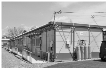
入居者は選考条件とコミュニティを考慮し民間委員を含めた「入居者選考委員会」で選定しています

※7人以上世帯か、2DKのみの団地に入居を希望する5人以上世帯は、隣り合わせの2戸に入居できるようにしています。