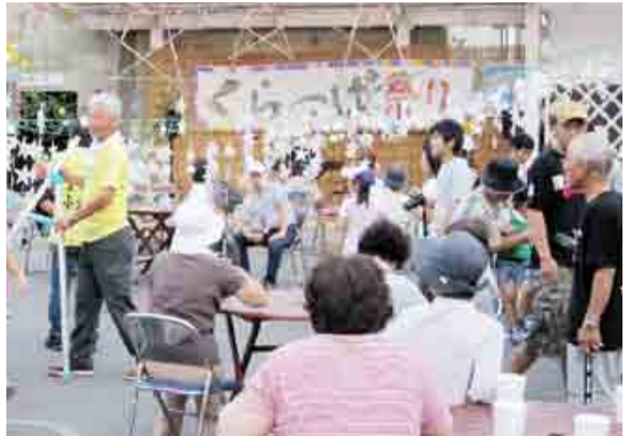
▲くらっば星まつりでは、笹飾りの願い事や天の川を表現した星型の電飾に、震災からの復興を願いました(8月6日、蔵しっくパーク)