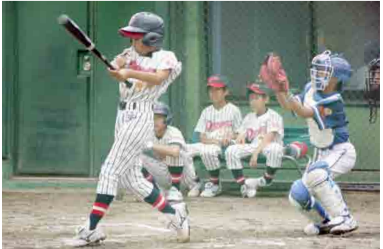
▲「震災復興カンパロウ少年野球交流大会」が開かれ、選手たちは全力プレーで勝利を目指しました(7月31日、鷹来の森運動公園)