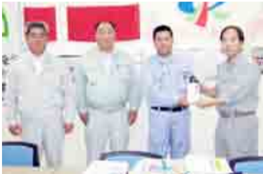
▲東松島市建設業協会より義援金を手渡されました。震災後、2度目の寄付になります(7月28日、市役所)