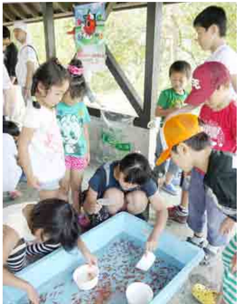
▲奈良県大和郡山南市の郡山南小学校と宮戸小学校の子どもたちが「金魚すくい」で交流を深めました(7月25日、奥松島縄文村歴史資料館)