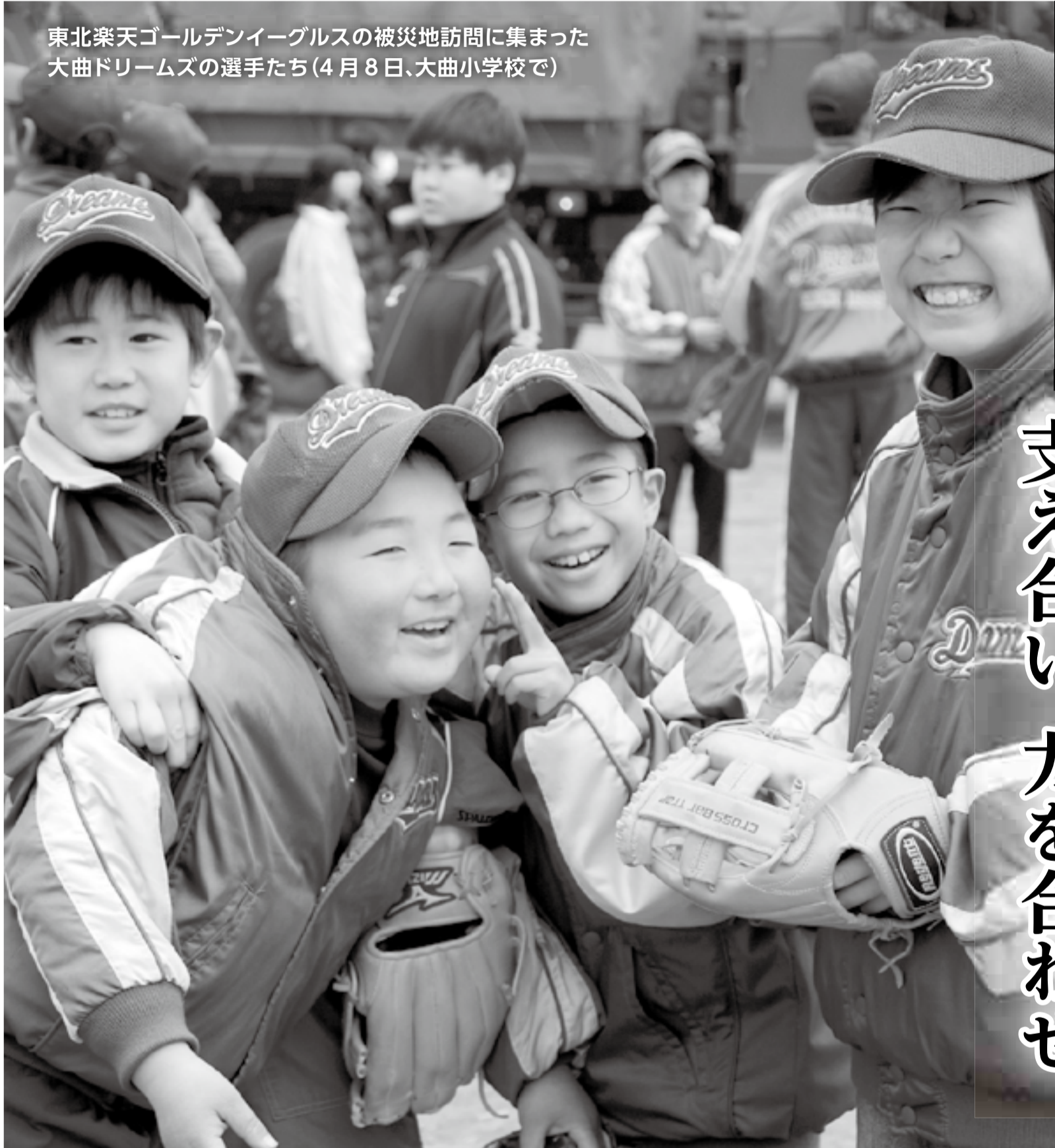
東北楽天ゴールデンイーグルスの被災地訪問に集まった大曲ドリームズの選手たち(4月8日、大曲小学校で)