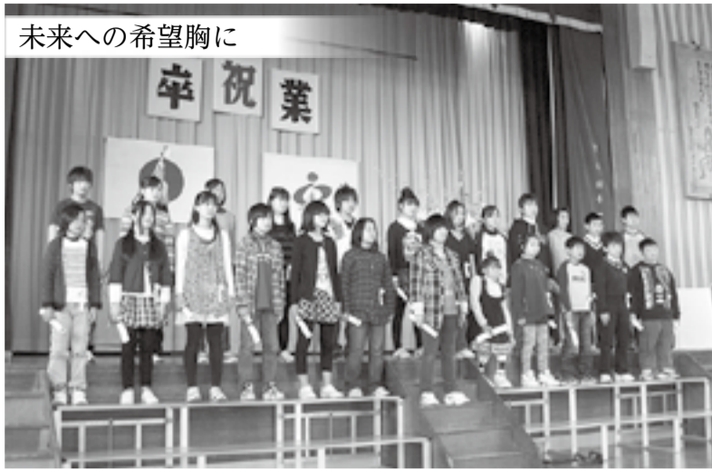
未来への希望胸に