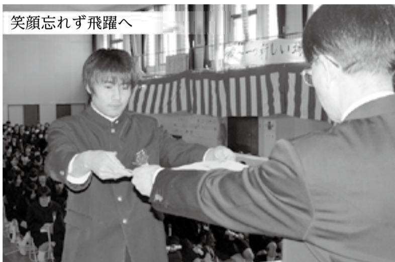
笑顔忘れず飛躍へ