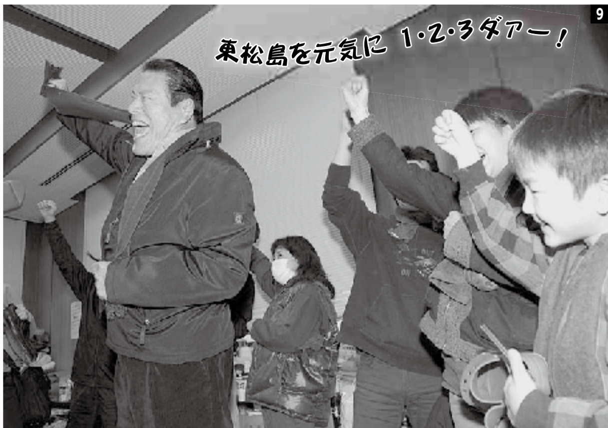
9 H23.4.5 アントニオ猪木さんが避難所訪問 (小野市民センター)