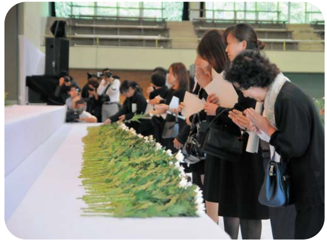
祭壇に花を手向け犠牲者の冥福を祈る参列者

釜石市合唱協会の献歌後、参列者一人一人が祭壇に花を手向け犠牲者の冥福を祈りました。