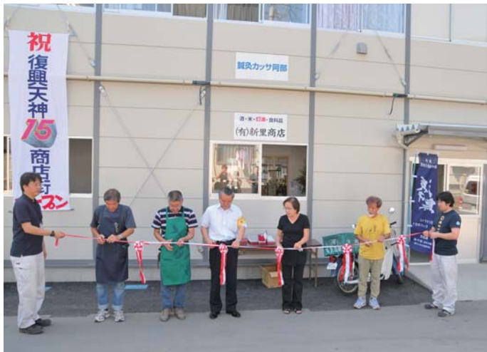
オープニングセレモニーでテープカットを行う関係者の皆さん