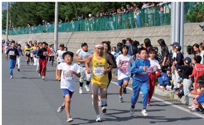
沿道に詰め掛けた観客の声援を受け、ゴールを目指した参加者