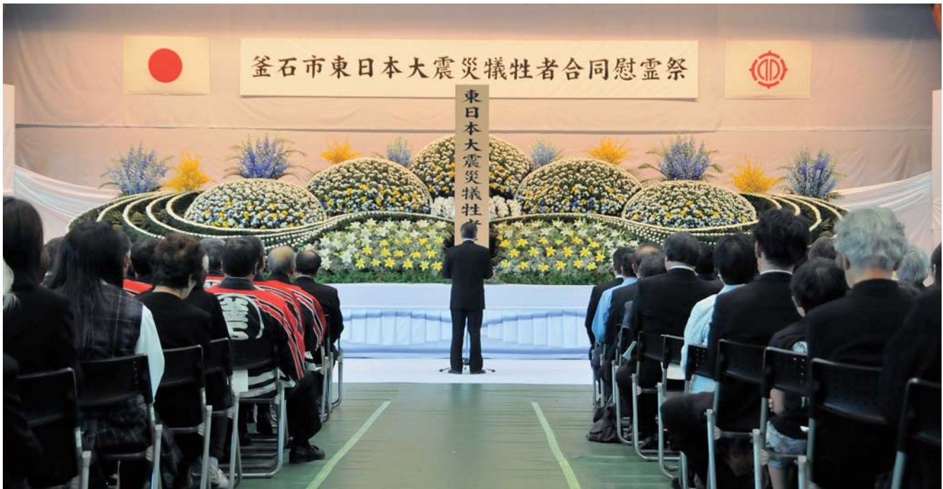
式辞の中で犠牲者に追悼の言葉を捧げる野田釜石市長