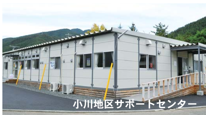
小川地区サポートセンター