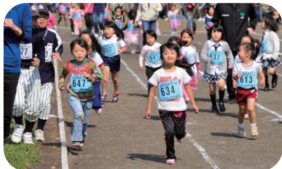
幼稚園・保育園の子どもたちも400メートルの部に参加

参加者は年齢に応じて3.2km、2.3km、1.5km、400mの部に挑戦。家族や仲間からの声援に背中を押されてゴールを目指し、心地いい汗を流していました。