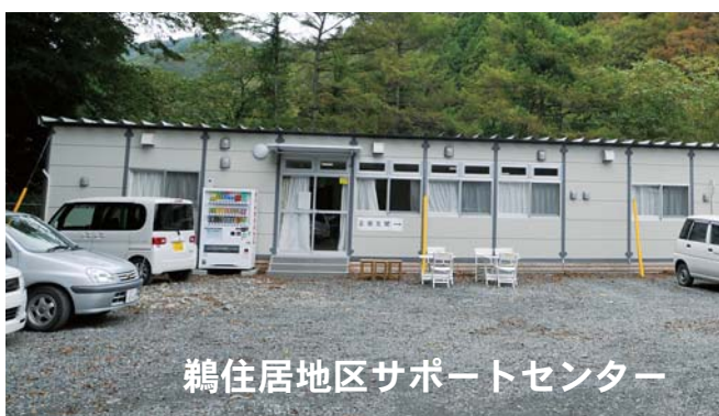
鶴住居地区サポートセンター