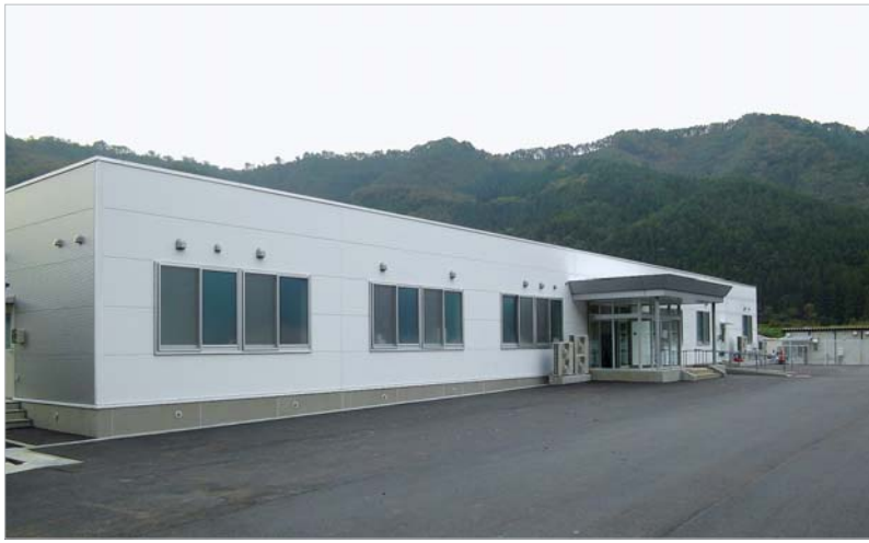
鵜住居田郷地区に整備された「釜石市鵜住居地区医療センター」