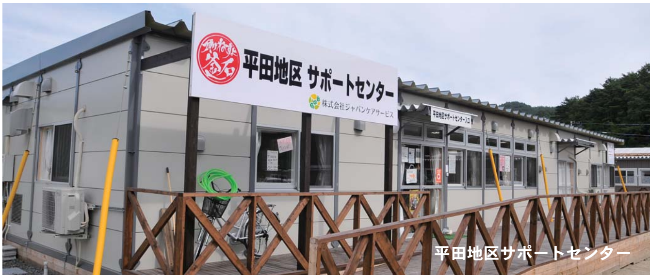
平田地区サポートセンター