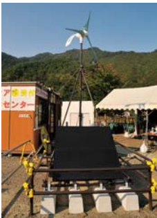
鈴子町・ボランティアセンターに設置された同システム