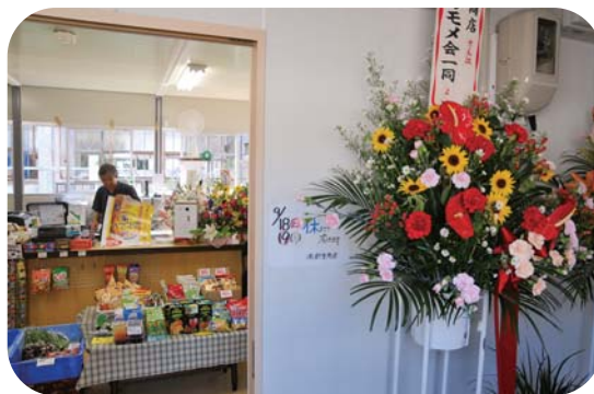
小売店や飲食店など15事業所が入居

天神町の仮設住宅団地内に県内第1号となる仮設店舗「復興天神15商店街」がオープンしました。市内東部地区の小売店や飲食店、電気店、歯科医院、美容院など15事業所が入居。オープニングセレモニーでは、関係者がテープカットで開店を祝いました。