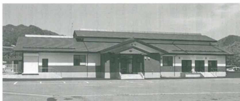
新設されたヨーグルト工場