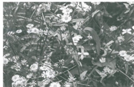
コハマギク(キク科)

※皆さんからお寄せいただいた草花などを紹介します。 写真に資料を添えてお送りください。