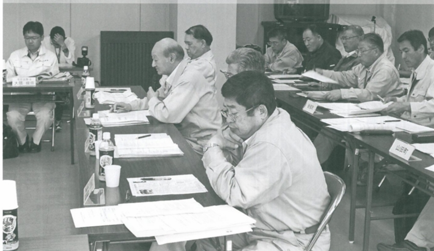
国への要望事項を述べる伊達町長