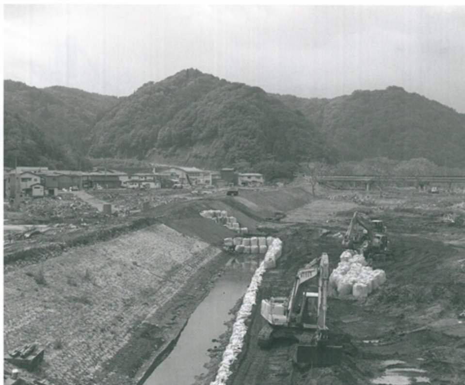
復旧作業中の小本に緊張が走りました

東日本大震災の余震とみられ、気象庁は今後もマグニチュード7程度の余震が起きる可能性があるとしています。