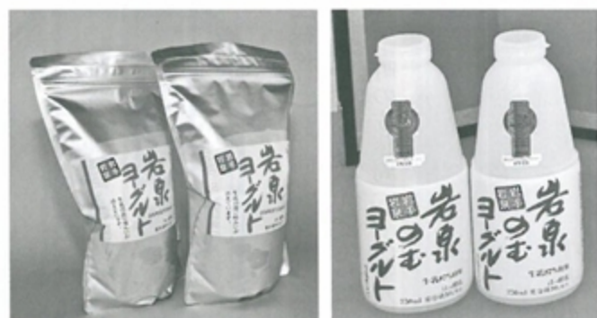
受賞した岩泉ヨーグルトと岩泉のむヨーグルト

発表会終了後は、岩泉乳業製品の試食会も行われ、世界に認められた「岩泉ヨーグルト」の味を堪能しました。