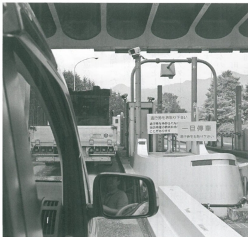
混雑する高速道路

被災証明書での高速道路無料通行が開始され、道路上は普段に比べて交通量が非常に多く、特に大型トラックが目立ちます。