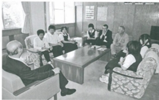
伊達町長と懇談する小本中の生徒ら

泉中学校の校舎を間借りしていますが、地区間の気温差で体調を崩す生徒が出ているそうです。当日のアメダスを見ると、岩泉の気温は午前11時で27・3度。対して小本は同時刻で17・9度と、広大な面積を誇る本町では同じ町内でもこれだけ気温に差があります。