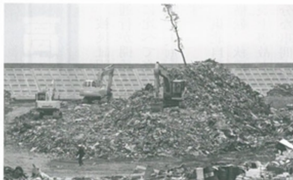
宮古市から搬入された震災がれき